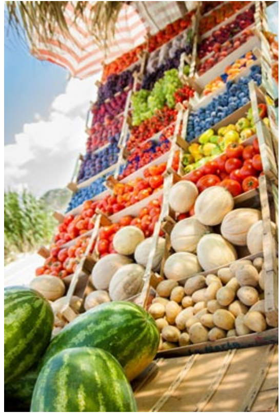
Michał Charyton "Przydrożne stoisko"